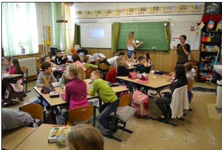
8. kép Eredményre várva