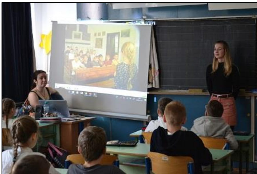
6. kép A régi-új iskola

Természetesen az új iskoláról sem feledkeztünk meg. Ebben a világban élnek a gyerekek, tudják, milyen, ezért inkább összehasonlítottuk a múltat a jelenel. Az elsősökkel például a Tankocka oldal segítségével készült feladatot oldottunk meg (1): két csoportba kellett rendezni a képeket aszerint, hogy időben melyik iskolába tartoznak. A másodosokkal vitát kezdeményeztünk, amelyben az egyik fél a régi iskola mellett, a másik pedig az új iskola mellett érvelt: melyik a jobb, melyikbe járnának szívesebben.