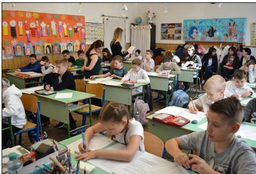
5. kép A feladatlapok megoldása közben