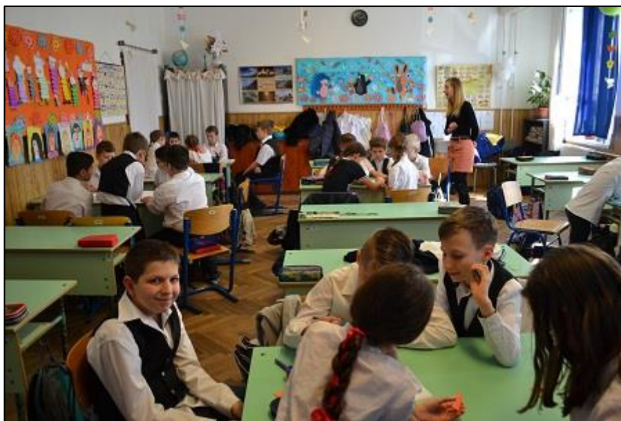
7. kép A csapatok vetélkedése