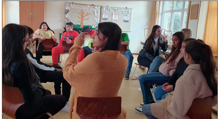
4. kép. Drámapedagógiai pályaorientációs mentorfoglalkozás a tari iskolában

Úgy érzem, hogy én magam is sokat fejlődtem mentorként. Most tudatosult bennem igazán, hogy az eszköztár, amelyet egy-egy foglalkozáson alkalmazhatunk, kimeríthetetlen, hiszen mindig van lehetőség arra, hogy akár magunktól, akár mások segítségével új feladatokat találjunk ki, azokat a »gyerekeinkre« formáljuk. A következő félévet is ilyen szellemben fogjuk végigjárni a gyerekekkel és a mentortársaimmal.”