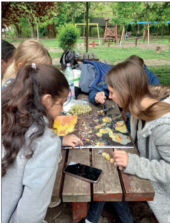
3. kép Pályaorientációs művészeti mentorfoglalkozás a ceglédi iskola udvarán