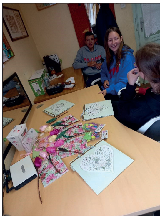
2. kép Pályaorientációs művészeti mentor foglalkozás a ceglédi iskolában

„Lepkeorchideát vettem a gyerekeknek motivációs virágként, hogy tanulásra ösztönözze a gyerekeket. A feladat az volt, hogy amennyiben haza szeretnék vinni, akkor nevezzék el és neveljék fel az orchideát, és legyen ott velük mindig az íróasztalukon tanuló társként. Tari Annamária Hol a boldogság mostanában? című pszichológiai könyvéből olvastunk el közösen egy fejezetet, amit meg is beszélünk: ez a társas kapcsolatokról szólt, hogy hogyan személytelenedik el a közösségi média hatására. Ezt követte egy önismereti teszt kitöltése, aminek az