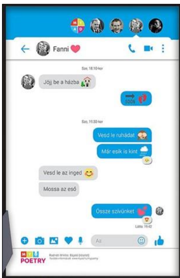
7. kép Radnóti a Messengeren

A levelek átírása, felolvasása/kivetítése után könnyen megállapítható az internetes nyelv, a digilektus (Veszelszki 2012) jellemzőinek a mibenléte. Amellett, hogy a szleng várhatóan hangsúlyosan meg fog jelenni az üzenetekben, minden bizonnyal számos rövidítés, emoji, idegen nyelvű kifejezés is található lesz bennük, amelyek a netnyelv sajátjai (Crystal 2001). Arany és Petőfi levelei éles kontrasztban állnak a ma Messengeren használt levelezési formával mind szerkezetileg, mind stilárisan. E különbségek a feladat során szembetűnővé válhatnak a diákok számára, ezáltal tudatosítva saját mindennapi internetes kommunikációjuknak a jellemzőit.