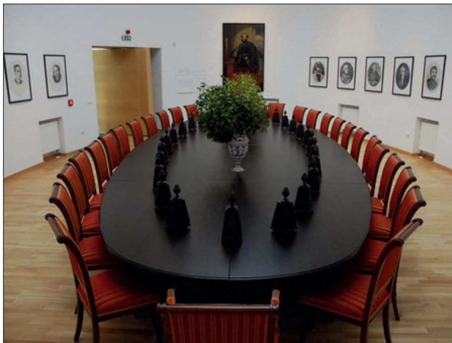
2. kép A Magyar Nyelv Múzeuma Akadémiai terme