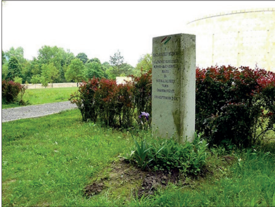
1. kép A Magyar Nyelv Múzeumának emlékparkja