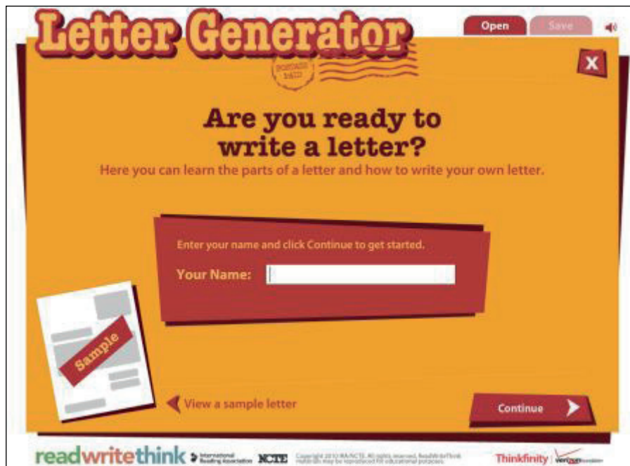
1. ábra Levélkészítő program (Letter Generator)

A meggyőzéstérkép (Persuasion Map) (5) használatakor a célunk megfogalmazásával vagy a tételünk megadásával kezdünk, majd azokat a főbb okokat kell kifejtenünk, amelyekkel meg kívánjuk győzni a közönséget arról, hogy a célunk helyénvaló, a tételünk igaz. Ezt követően mindhárom okot alá kell támasztanunk olyan tényekkel vagy példákkal, amelyek igazolják a kiinduló tételünket. Az utolsó lépés az összegzés, amelyben összefoglaljuk érvelésünk legfontosabb elemeit, kifejezve még egyszer, mit várunk a közönségtől. Az eredmény egy kinyomtatható érvtérkép lesz. Ez a feladat az órán az előkészítés fázisában jelenik meg azzal a szándékkal, hogy a diákok még a levél megírása előtt rendszerezék a gondolataikat, gyakorolják az érvelés menetét, és gondolják végig, mi lesz a levelük célja, mit kívánnak vele elérni.