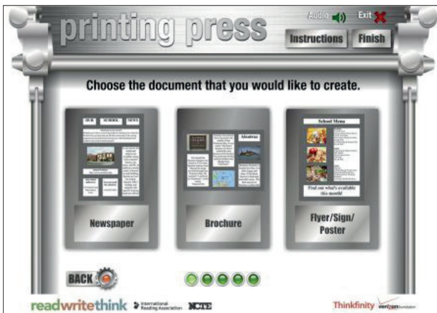
3. ábra Kiadványkészítő program ( Printing Press )

A kiadványkészítő program ( Printing Press ) 2013-as frissítés a honlapon (6). Ehhez a legújabb interaktív programhoz (3. ábra) máris számos óravázlat, felhasználási javaslat kapcsolódik. Választhatunk, hogy újságot, brosúrát, röplapot, plakátot vagy prospektust készítünk. A munkát minden esetben utasítások, magyarázatok segítik. Választhatunk a meglévő sablonok közül, fotókat tölthetünk fel, szövegeket írhatunk az üres szövegmezőbe. Lehetőségünk van a megkezdett munka mentésére és így a későbbi folytatására is. A munka során bármikor visszatérhetünk, korrigálhatunk a megelőző szinteken.