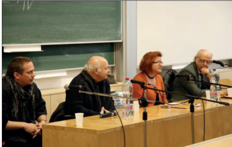
4. kép Író-olvasó találkozó