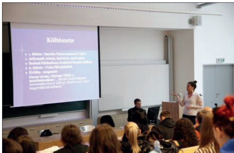
3. kép A diákok előadása a döntőn