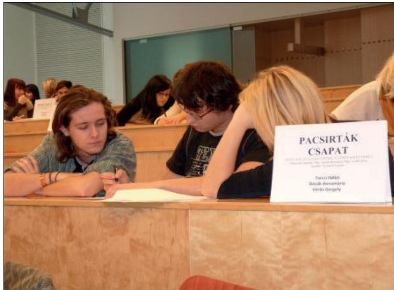
2. kép A csapatok a tesztlapok kitöltése közben