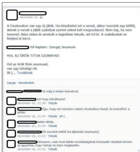
3. ábra Versajánló lánc a Facebookon (4)

A szépirodalmi szövegek jelenléte a Facebookon szintén mindennapos dolog. Tanárként és magánemberként is oszthatunk meg idézeteket irodalmi művekből, és ezeket különböző feladatokhoz használhatjuk. Nemrégiben terjedt el az oldalon az a „játék”, miszerint a megosztó kiteszi az idővonalára a játék szabályait, és a bejegyzést lájkolóknak a bejegyzés kommentjeibe ajánl egy költőt. A lájkoló utánanéz a kapott költőnek, és később a saját idővonalán közzétesz tőle egy verset, mellékelve a játékszabályokat is, így majd a bejegyzése lájkolóinak ő ajánlhat költőt. Indoklást vagy véleményt is megfogalmazhatnak a diákok a választott verssel kapcsolatban. Az üzenőfali bejegyzések kommentjei között sok új információ is felbukkanhat a gyűjtőmunka eredményeképpen. Egy ilyen tanári bejegyzést láthatunk a 3. ábrán, ahol a diákok közül először nem mindenki érti a játék lényegét, ám a pedagógus útbaigazítja őket.