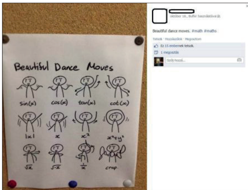
6. ábra Függvények alakjának a gyakoroltatása (4)

Az anyanyelvi nevelés mellett más lehetőségek is kínálkoznak a tanári Facebook-használatban. Nemcsak a magyarórák tananyagát egészíthetjük ki, színesíthetjük játékokkal, humoros kiírásokkal, hanem tulajdonképpen bármelyik tantárgy esetében is alkalmazhatjuk őket. Erre jó példa a 6. ábra képe, amely matematikai ismereteket elevenít fel, ismételtet: a függvényeket gyakoroltatja egy humoros, jópofa kép segítségével.