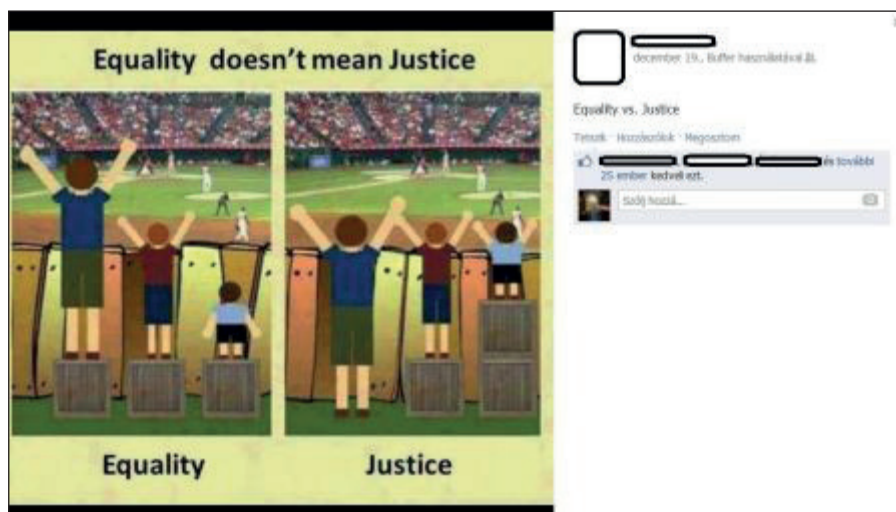
5. ábra Egyenlőség vs. igazság (4)

Nyithatunk vitát erkölcsi kérdésekben is, például az egyenlőség és az igazság egyensúlyáról szól az előzőhöz hasonlóan elgondolkodtató, de humorosnak is mondható kép (5. ábra), amely ugyancsak Facebook-mém. A tanári megosztás érvelési láncot indíthat el, bár a jelenlegi idézett bejegyzésben csak lájkokkal mondták el a véleményüket a témáról a diákok.