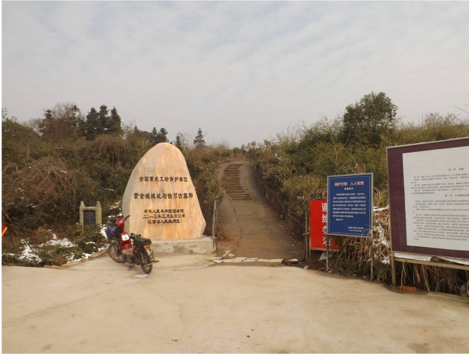
4. kép Feljárat a szigorúan őrzött császári temetkezéshez Nanchang környékén

délyezettési procedúráján kell átesni, amely a külföldiek számára nem látogatható lelőhelyek, illetve a zajló ásások esetében még összetettebb. A törvény egyes cikkelyei ellen vétőkkel szemben határozottan fellépnek. 38 Mindez jelentősen behatárolja a külföldiek tudományos lehetőségeit, még a publikálatlan leletek és lelőhelyek megtekintését (nemhogy kutatását) is el lehetetlenítve (4. kép).