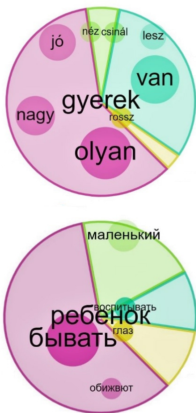
3-4. ábra: A gyerek és a ребёнок szavak elemzése a Sketch Engine szoftver segítségével. Orosz feliratok a jobb oldali ábrán: ребёнок (gyerek); воспитывать (nő); обижают (bánt); бывают (van); глаз (szem); маленький (kicsi/pici).

(Kilgarriff, 2014) egy online korpusznyelvészeti eszköz, melynek segítségével szavak milliárdjaiból álló korpuszok összehasonlítása válik lehetővé. Elemzésünk során a kutatás folyamán nyert nyelvi adatokat feltöltöttük a Sketch Engine rendszerébe, és a Sketch Engine elemzői funkciói segítségével elemeztük azokat.